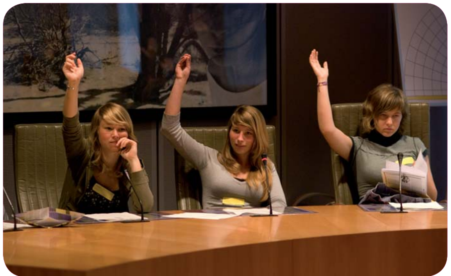
De jongeren lusten wel pap van het thema 'Foodfight. De wereld kookt.'

De middagpauze in het Warandepark was voor de verandering eens niet zonovergoten, maar ging schuil